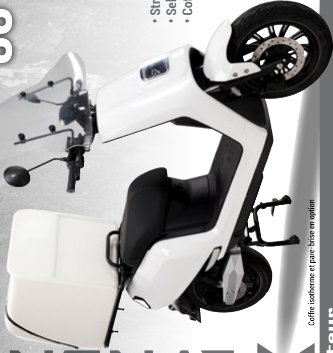
Coffre isotherme et pare-brise en option