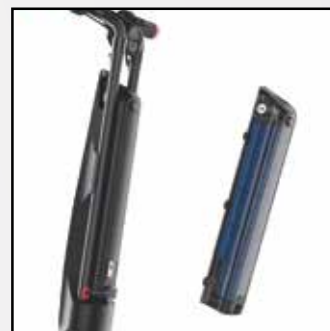
Batterie amovible verrouillage par clé (2 clés fournies)

Garantie 2 ans structure et composants électroniques