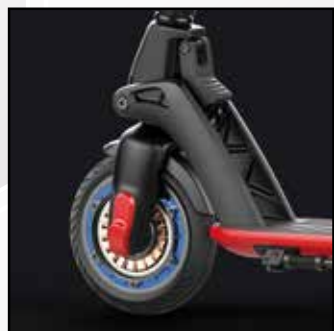
Moteur avant 300W sans frictions