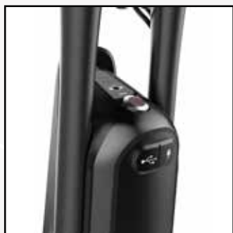
Détail bouton marche et prises USB et chargeur