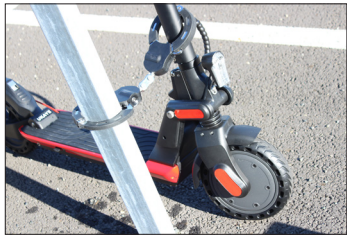
Exemple de mise en situation - Photo non contractuelle