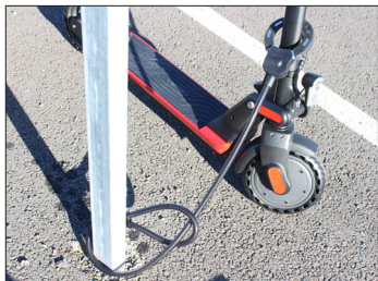
Exemple de mise en situation - Photo non contractuelle