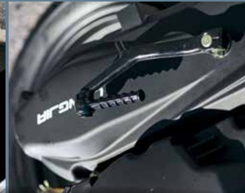
Démarrage au kick possible