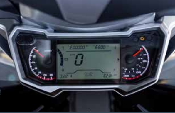
Compteurs analogiques avec ordinateur de bord