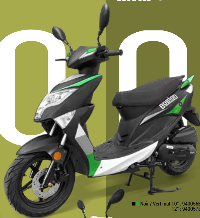
■ Noir / Vert mat 10" : 940056E 12" : 940057E