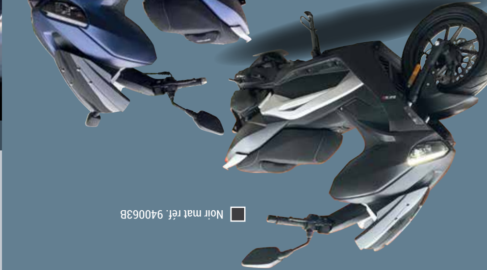
Noir mat réf. 940063B