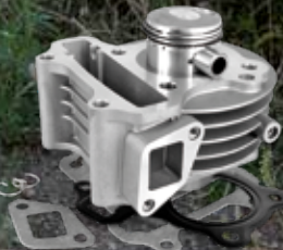
(030317) Cylindre complet Alu