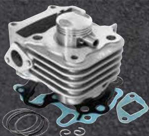
(030321) Cylindre complet Alu