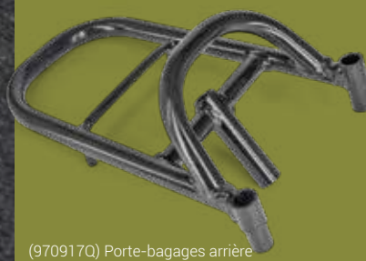
(970917Q) Porte-bagages arrière