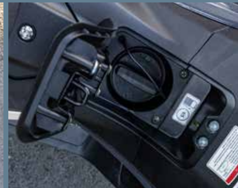
Trappe à essence sécurisée