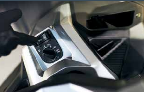
Démarrage sans clés fournis : 2 télécommandes