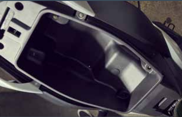
Large coffre sous selle verrouillable