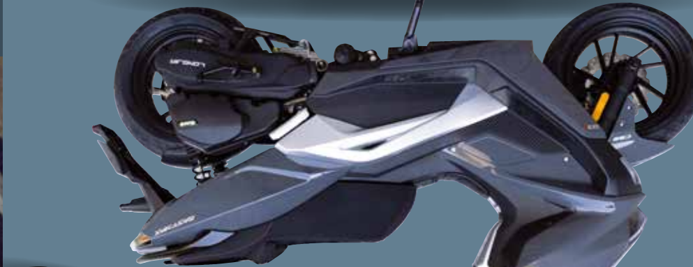
Gris Nardo réf. 940063D