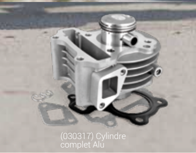
(030317) Cylindre complet Alu