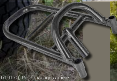
(970917Q) Porte-bagages arrière