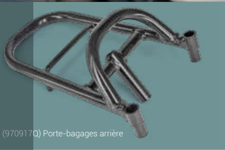
(970917Q) Porte-bagages arrière