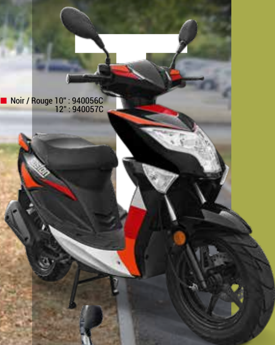
■ Noir / Rouge 10" : 940056C 12" : 940057C