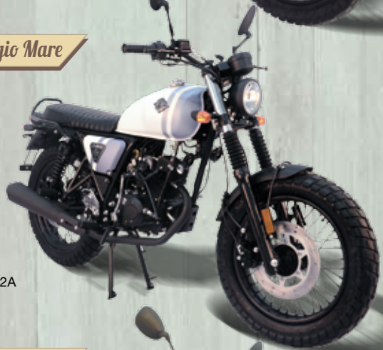
Bianco - Grigio Mare