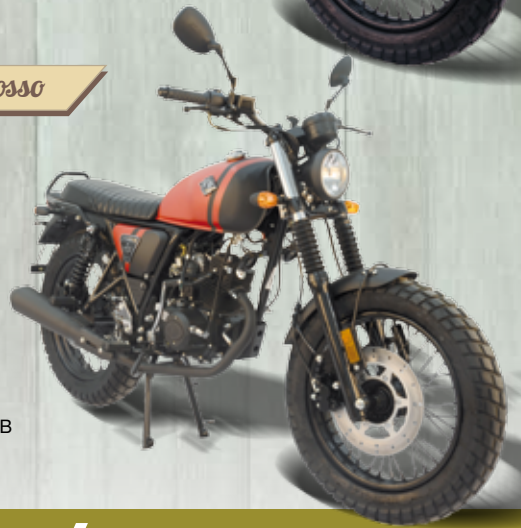
Nero - Rosso